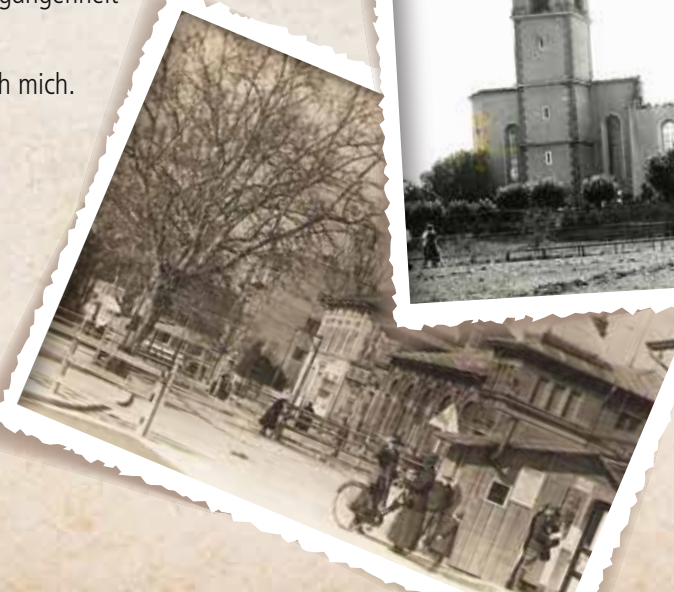
Hauptstrasse, 1956 Hafenrestaurant, 1962 Kloster Kirche, 1963 Grenze Kreuzlingen, 1921